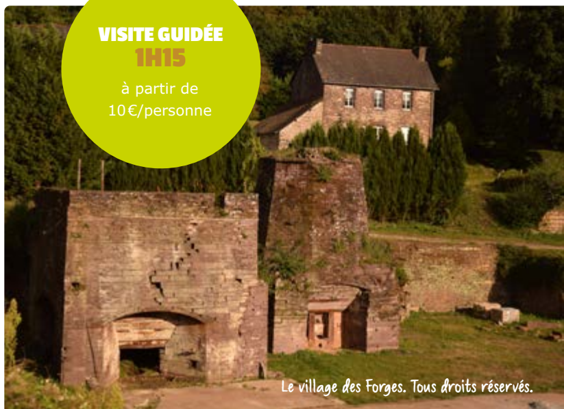
Le village des Forges. Tous droits réservés.