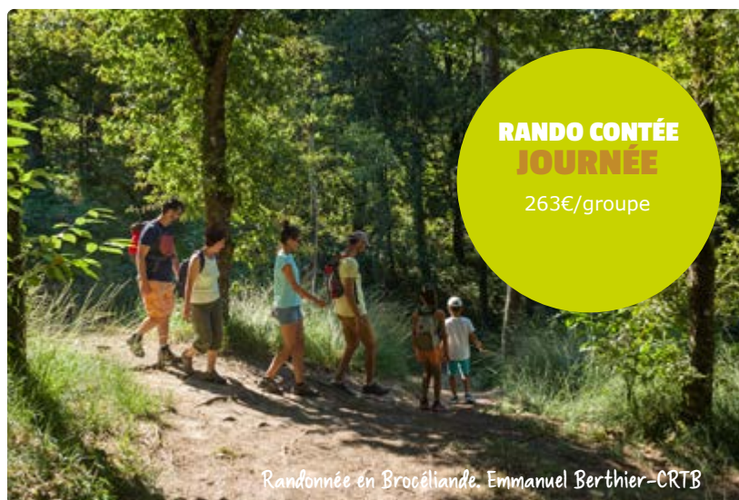
Randonnée en Brocéliande.