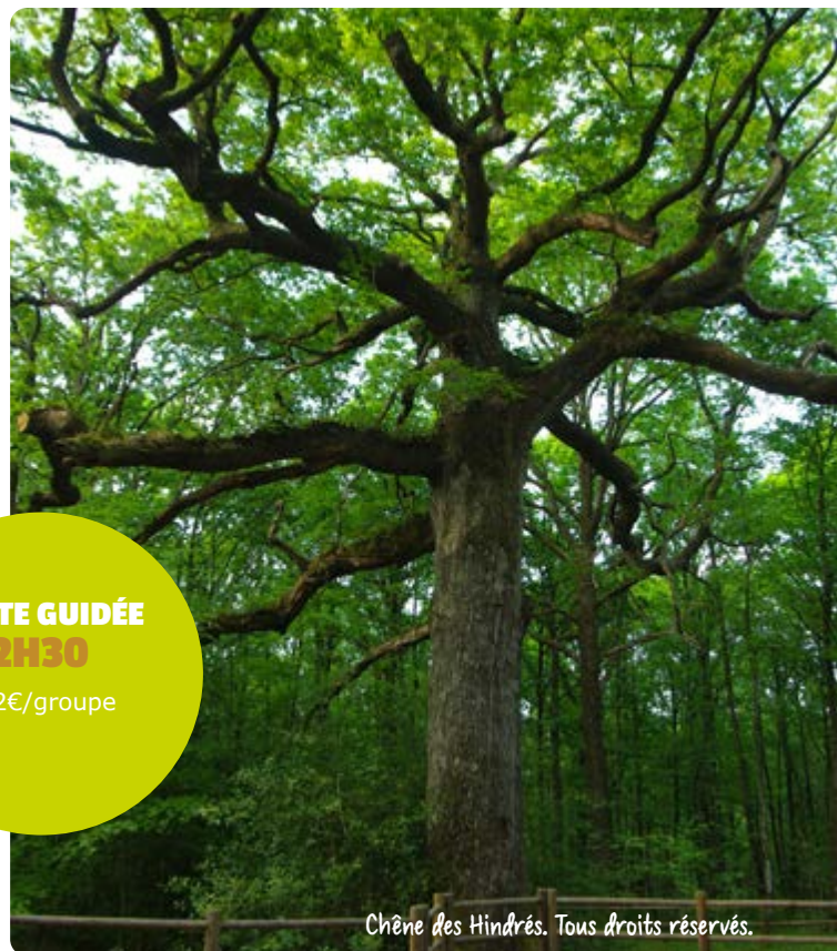
Chêne des Hindrés.