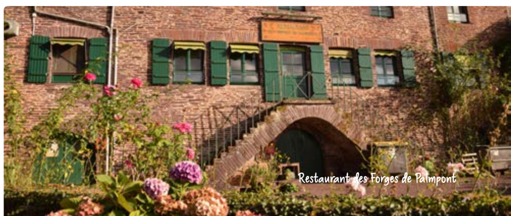
Restaurant des Forges de Paimpont

* Menus identiques à tous les convives, sous réserve de changement selon la saison.