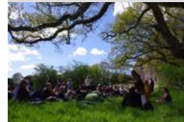
château de comper

02 97 22 79 96 Un des incontournables du Centre Arthurien! Accompagnés en musique, les conteurs du vous font revivre les aventures de légendaire. A 16 h.