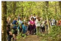
Office de Tourisme de Brocéliande

Paimpont Balade contée: Il était une fois Brocéliande Office de tourisme