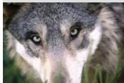
Office de Tourisme de Brocéliande

Paimpont Randonnée contée: Huche Loup et Loup Pendu ! RDV parking du chêne des Hindrés