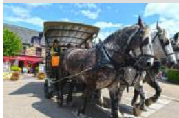
Office de Tourisme de Brocéliande

Paimpont Sortie contée en calèche: Cocher, gare aux korrigans ! Office de tourisme