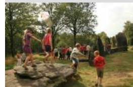
Association Les Landes

Monteneuf Grand jeu de piste familial Route de la Grée Basse