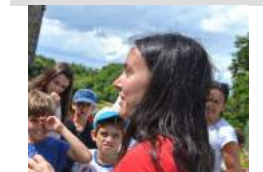
Office de Tourisme de Brocéliande

Paimpont Balade contée: Merlin et le petit peuple de la forêt Office de tourisme