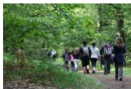
© Marche gourmande de Brocéliande 26 mai

le 26/05/2018 Musiques traditionnelles, Randonnées, Balades nature, Circuit / Visite Tarifs Tarifs non communiqués