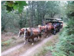
© Balade en calèche - Monteneuf - Destination Brocéliande