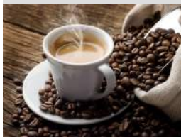
©Tous droits réservés