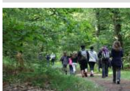
© Marche gourmande de Brocéliande 26 mai