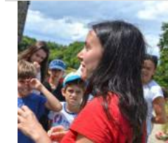
Office de Tourisme de Brocéliande