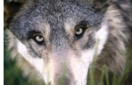
Office de Tourisme de Brocéliande