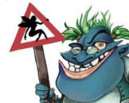
Office de Tourisme de Brocéliande

02 97 22 79 96 badlagoule@centre-arthurien-broceliande.com