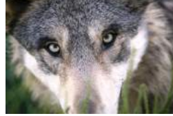
Office de Tourisme de Brocéliande