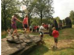
Association Les Landes